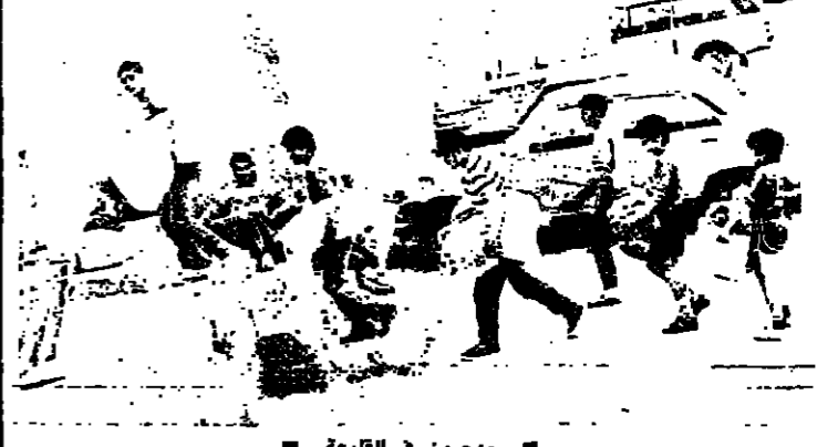
مهجرون في القليعة

عقدت لجنة القليعة المولجة تسير امور المهجرين وايوائهم وتوزيع المساعدات عليهم مؤتمرا صحفيا في منطقة القليعة أمس شرحت فيه اوضاع المهجرين ومطالبهم والجهود المبذولة في المنطقة ، وركزت على ان التعاليم تقسم مشترك وحيث بين اللبنانيين . وقالت اللجنة : ان جميع جراح المهجرين والفتات اهدت بقضية المهجرين المسيحيين ما عدا الدولة اللبنانية التي تصرفت وتصرف كما لو ان المهجرين لا يعنون لها شيئا ، ولا يحملون الهوية اللبنانية .